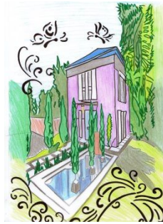
Geliebter gleich alter guter und herzlicher Mann