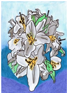
Möglicher neuer Mann Älterer Mann Vater, Schwiegervater