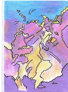
Rivale, Nebenmann der Ex gleich alt, schwierig