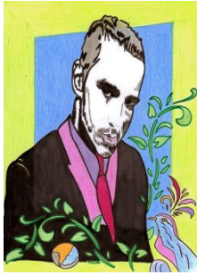
Fragesteller Ehemann Bei Singles neuer HM