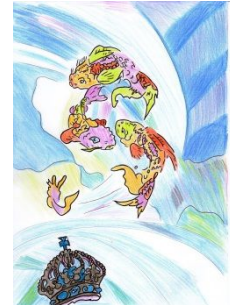
mögl. neuer Mann jüngerer Mann Bruder, Onkel